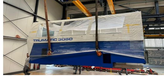
Ağır bir kargo: Yedi tonluk bar, Matyssek Metalltechnik'in montaj salonuna ulaştı.