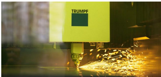
Seit März machen die Mitarbeiter bei FBT den Zuschnitt von Dünublech und Platinen mit ihrer neuen TruLaser 3030. <br />Foto: Stephen Duscher