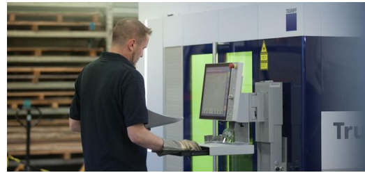
Die Maschine wird mit der Software TruTops Boost programmiert, mit der sich Fertigungsprogramme kinderleicht in einem System erzeugen lassen. <br />Foto: Stephen Duscher