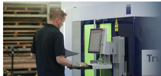
Die Maschine wird mit der Software TruTops Boost programmiert, mit der sich Fertigungsprogramme kinderleicht in einem System erzeugen lassen. <br />Foto: Stephen Duscher