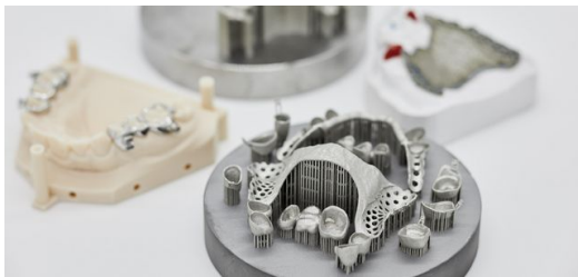
Zahnersatz aus dem 3D-Drucker TruPrint 1000 von TRUMPF.