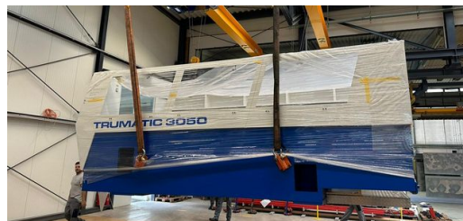
Ťažký náklad: Sedem ton vážiaci bar pri príchode do montážnej haly firmy Matussek Metalltechnik.