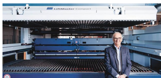
Systém plnoautomaticky vyrezáva dielce v závode výrobcu chladiacich vitrín