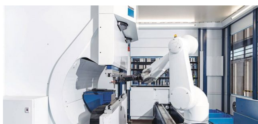
Inovatívna ultra rýchla pracovná kabína ohýbania: TruBend Cell 7000 je