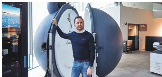
«...»: «...», ... AEC Illuminazione, ... ...»