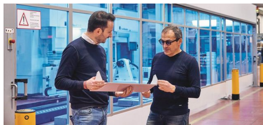
«...»: «...», ... AEC Illuminazione ... ...»