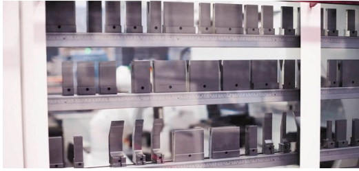
Эти машины используются в производстве, например, для изготовления деталей для автомобилей, станков, сельскохозяйственной техники и т.д. TruBend Cell 7000, TruBend Cell 5000.