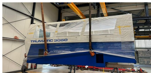
Carga pesada: O bar de sete toneladas chegando ao salão de montagem da Matyssek Metalltechnik.