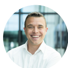
DANIEL KURR COMUNICAÇÕES DO GRUPO TRUMPF

A ideia básica do desenvolvimento conjunto da Procter & Gamble e da toolcraft era aplicar estruturas em bigornas usando a deposição de metal a laser. Isso não apenas prolonga a vida útil dos componentes, que estão muito sujeitos a desgaste, como também repara o desgaste da estrutura.