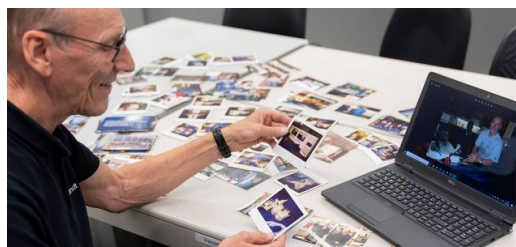
Deleitando-se com os velhos tempos: milhares de fotos de lembrança foram tiradas ao longo dos anos na TRUMPF.