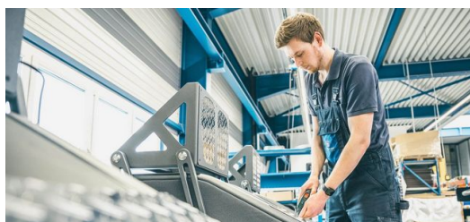
A TruMatic 7000 corta e molda as chapas estriadas de alumínio para os equipamentos EGYM sem arranhões e com a melhor qualidade.

Foi um sucesso: a Steinhart oferece todo o espectro de processamento de chapas, desde a máquina combinada de punçionamento e laser até uma célula de dobra e três máquinas de corte de tubo a laser. "Aqui só usamos máquinas TRUMPF", explica Genkinger, e acrescenta. "Ao projetar a estrutura para o primeiro EGYM, nosso know-how bem fundamentado na área de corte de tubos a laser foi uma grande ajuda." A articulação da estrutura do equipamento consiste 70% em tubos ovais feitos de aço de construção estável com um belo visual. "Para o processamento, apostamos em nosso TruLaser Tube 5000 e em nosso TruLaser Tube 7000 . Ambos são equipados com a opção de corte oblíquo e podem cortar roscas." O que só seria possível na produção convencional em vários passos de trabalho, as máquinas de corte de tubos a laser da TRUMPF podem fazer em apenas uma fase de processamento. A chapa estriada para apoiar os pés sai sem arranhões da TruMatic 7000 , e a aresta de dobra necessária para a fixação na estrutura é realizada pela TruBend 7036 Cell . Os sistemas eletrônicos e algumas peças de plástico são fornecidas para a Steinhart. Após o revestimento em pó da estrutura, todos os componentes são montados em unidades completas.