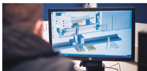
Giacomo Bianchi planejou a aquisição da TruBend Cell 5000 principalmente para a dobra de carcaças e fixações maiores.