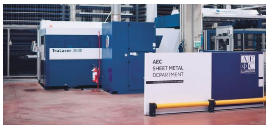
Com a máquina de corte laser 2D TruLaser 3030 fiber, a AEC Illuminazione definiu um marco para a estreita cooperação com a TRUMPF. A integração em um armazém automatizado acelerou muito a produção.

corredores para a continuação do processamento. Para que isso não aconteça, é necessário ter fluxos de informação transparentes e contínuos. Por este motivo, atualmente Bianchi já colocou 85% de todas as máquinas em rede. O sistema de controle de produção MES cria planos de produção e garante o fluxo da fabricação. Os construtores transferem seus desenhos CAD diretamente para a máquina. Eles são lidos na máquina e as peças são fabricadas quando necessário. Além disso, o MES coleta dados da máquina e números-chave para o monitoramento da qualidade, para o grau de utilização da máquina e para o status de produção. "Com esta integração abrangente em rede, conseguimos tornar a nossa produção transparente. Este planejamento de produção orientado para as pessoas e a máquina nos ajuda a aumentar os tempos de produção e melhorar em longo prazo a nossa confiabilidade de entrega", resume Bianchi.