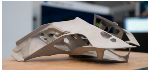
Com a TruPrint 3000 de 700 watts, componentes relevantes para a segurança, como essa parte da carroceria, podem ser produzidos de forma rápida e confiável.