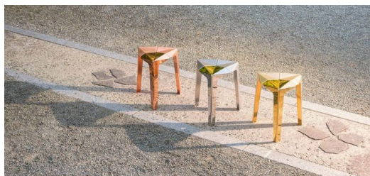
A cadeira "Orisu" em diversas cores: um objeto simétrico, feito de partes iguais e dobrado de metal como origami.