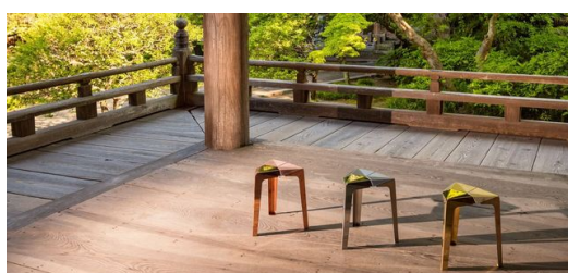
A cadeira "Orisu" é algo especial: ela torna tecnologias abstratas visíveis para quem a observa.