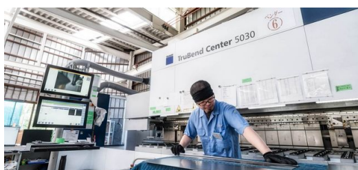
Um funcionário trabalha na TruBend Center 5030 : assim é fabricada a cadeira "Orisu".