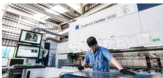
Um funcionário trabalha na TruBend Center 5030 : assim é fabricada a cadeira "Orisu".