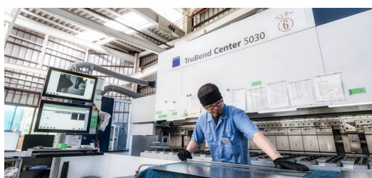
<p>Um funcionário trabalha na <a href="https://www.trumpf.com/de_DE/produkte/maschinen-systeme/biege-maschinen/trubend-center-serie-5000/">TruBend Center 5030</a>: assim é fabricada a cadeira "Orisu".</p>