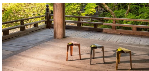
A cadeira "Orisu" é algo especial: ela torna tecnologias abstratas visíveis para quem a observa.

Yoshida não é o único que se envolveu com a arte em Kawaguchi: todos os anos, as fábricas realizam o Kawaguchi Machi-ka Art Festival , do qual Kazuhito Ishida é o diretor desde o ano passado. Várias obras de arte criadas em colaboração entre fábricas e designers são exibidas no festival. "A arte enriquece a vida das pessoas. Ela pode não ser necessária para a sobrevivência diante das crises atuais, mas sempre consegue colocar um sorriso no rosto das pessoas", diz Ishida. Assim, a cidade japonesa de Kawaguchi está passando por uma transição especial: de uma clássica cidade industrial com imagem antiquada para um lugar de design e arte; um lugar onde as pessoas vêm para se sentir bem.