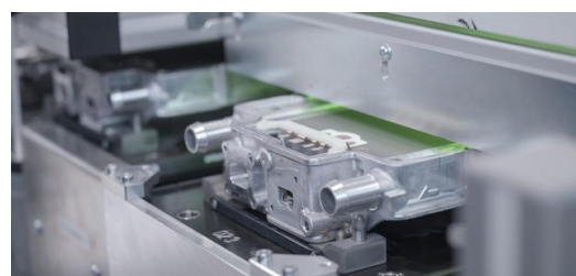
Laser 2: Fazer o contato de cobre com o laser verde. O comprimento de