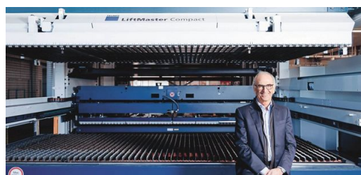
Em combinação com o LiftMaster Compact e o Part Master, o sistema corta as peças na produção do fabricante do balcões refrigerados de forma