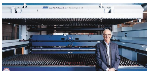
Em combinação com o LiftMaster Compact e o Part Master, o sistema corta as peças na produção do fabricante do balcões refrigerados de forma