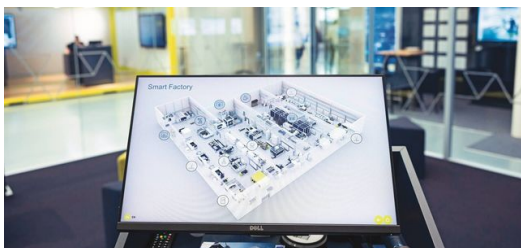
Dados da máquina, como os que a TRUMPF obtém em sua Smart Factory ajudam a equipe de visão computacional a treinar a IA.