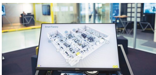
Dados da máquina, como os que a TRUMPF obtém em sua Smart Factory ajudam a equipe de visão computacional a treinar a IA.