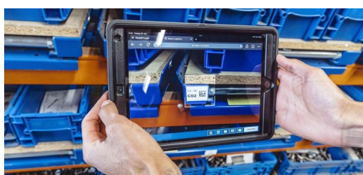
Em cada local de trabalho, os funcionários registram todas as etapas do trabalho do início ao fim em tablets, em um aplicativo. O acesso móvel a todas as informações facilita o trabalho diário e traz transparência aos processos.