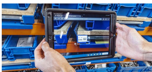
Em cada local de trabalho, os funcionários registram todas as etapas do trabalho do início ao fim em tablets, em um aplicativo. O acesso móvel a todas as informações facilita o trabalho diário e traz transparência aos processos.