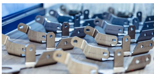
Em sua própria produção de chapas metálicas, a MERZ processa entre dez e