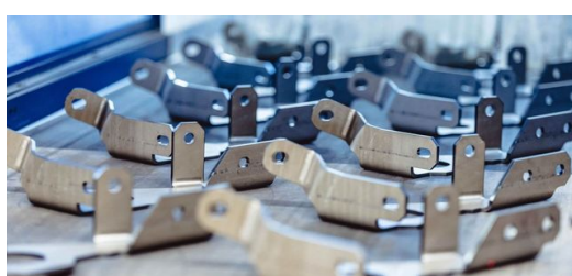
Em sua própria produção de chapas metálicas, a MERZ processa entre dez e