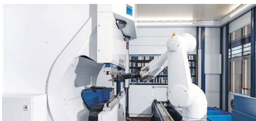
Innovatieve highspeed-buigcel: De TruBend Cell 7000 is een compact systeem waarmee kleine stukken zeer dynamisch en economisch kunnen