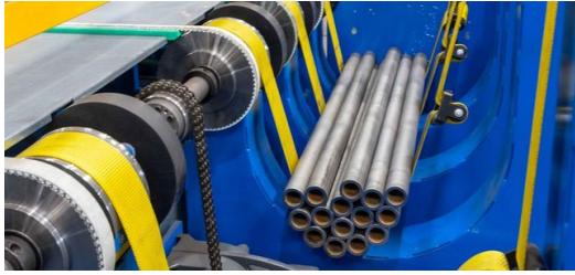
TruLaser Tube 7000