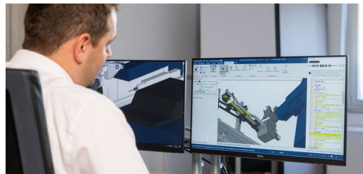
TecPro "TRUMPF transfluid@"