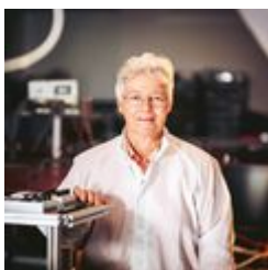
Anne L'Huillier (Lund) L'Huillier 2023 (Berthold Leibinger) Pierre Agostini Ferenc Krausz