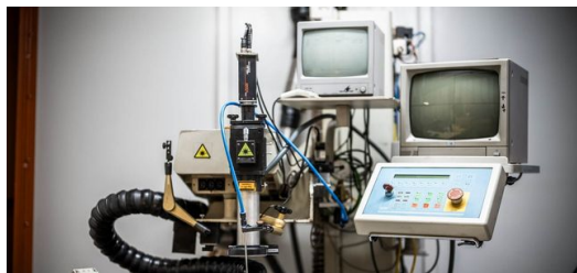
Ciò che convince viene mantenuto in uso. Nel contempo, la BBW continua a investire regolarmente nei più innovativi sistemi laser disponibili e ad ampliare costantemente il proprio portafoglio.

Un attimo – Conformazione del raggio? Esattamente. Questo perché lavorando al limite di ciò che è tecnicamente possibile per la BBW anche la conformazione del raggio gioca un ruolo estremamente importante. Per questo motivo, alcuni dei 50 impianti si trovano attualmente in fase di sviluppo per opera del team BBW, spiega Andreas Bürger. "Molto dipende dalle tecnologie di conformazione del raggio. Queste ci consentono di affrontare anche compiti complessi non eseguibili in modo stabile senza l'impiego di queste tecnologie, come ad esempio la stabilizzazione del bagno fuso durante la saldatura laser. "Per BBW è fondamentale che la conformazione del raggio rimanga variabile, poiché i sistemi ottici fissi non risultano essere economici per le nostre nicchie di mercato, caratterizzate da lotti di piccole dimensioni," come spiega Andreas Bürger. Solo quando il sistema ottico può essere personalizzato per ogni singola serie, risulta essere economicamente vantaggioso per BBW. "Ed è per questo che ora stiamo valutando come poterlo utilizzare. Credo che nessun altro saldatore laser possieda un sistema di conformazione del raggio laser, oltre a noi.