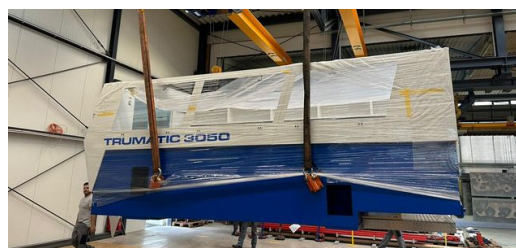
Nehéz rakomány: a Matussek Metalltechnik szerelvénycsarnokába érkezett héttonnás bár.