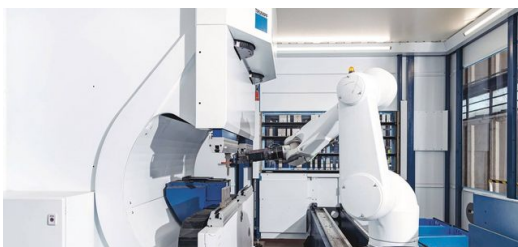
Innovatív nagy sebességű hajlítócella: A TruBend Cell 7000 egy kompakt rendszer a kisméretű munkadarabok rendkívül dinamikus és gazdaságos

José Júlio Jordão 1982-ben alapította a vállalatot az észak-portugál Guimarães-ben. 22 munkatárssal kezdte. Közben a személyzet 250 munkatárssal több mint megtízszereződött. Jordão napjainkban a személyre szabott és standard hűtőbútorok egyik vezető európai gyártója az élelmiszer-kiskereskedelem és a vendéglátóipar számára, és neves ügyfelei vannak szerte a világon, forgalma legutóbb 21,5 millió eurót tett ki.