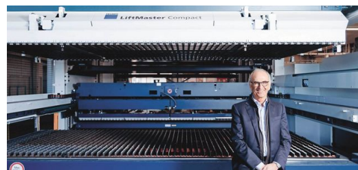
A LiftMaster Compact és a Part Master gépekkel kombinálva a rendszer teljesen automatikusan vágja az alkatrészeket a hűtőbútorgyártó termelési