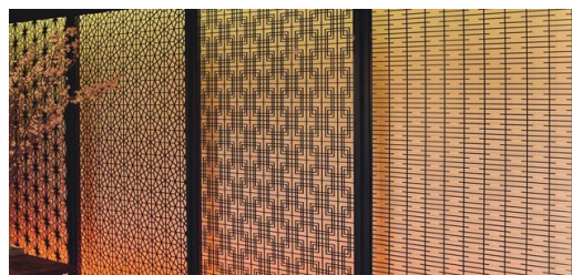
Nagyfokú pontosság: A régi Kumiko művészeti forma stabil része a japán architektúrának. Tipikus alkalmazások például a válaszfalak.