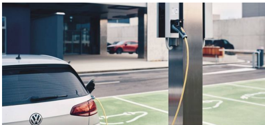
Conception durable : des cellules solaires sur le toit de l'usine alimentent les bornes de recharge de la flotte de l'entreprise.