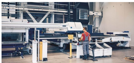
Soudage, poinçonnage, pliage : les machines TRUMPF assurent à Elpro une qualité de pièces, une productivité et une flexibilité maximales.