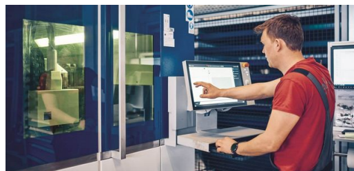
Partenaire recherché : le nom Elpro Križnič est synonyme de solutions complètes de haute qualité dans l'usinage de tôles et dans l'industrie de l'énergie.