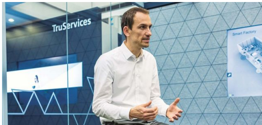
Expliquer l'IA : l'expert en vision par ordinateur de TRUMPF explique volontiers en quoi l'IA est utile dans la découpe de tôles.