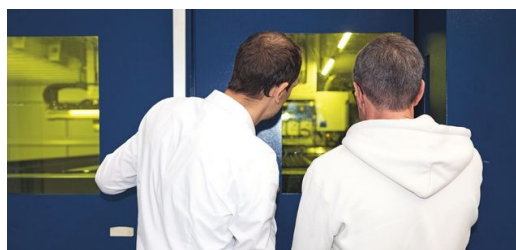
Des données, encore des données : plus il y a de petites caméras dans un TruLaser Center 7030, plus l'équipe de Korbinian Weiß reçoit de données. Les spécialistes de l'équipe les utilisent pour entraîner l'IA. Plus il y a de données, meilleurs sont les résultats.