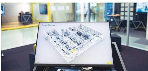
Les données machine, telles qu'elles sont collectées par TRUMPF dans son Usine du Futur, aident l'équipe de vision par ordinateur à entraîner l'IA.