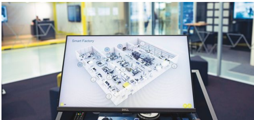
Les données machine, telles qu'elles sont collectées par TRUMPF dans son Usine du Futur, aident l'équipe de vision par ordinateur à entraîner l'IA.