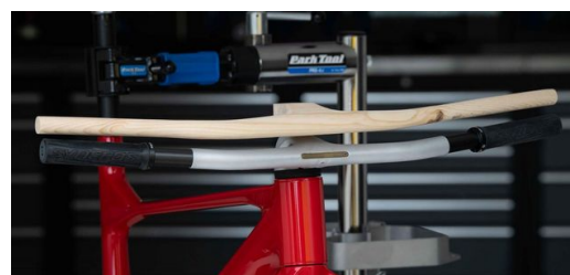
Un travail d'homme des cavernes : c'est ainsi que Dangerholm a qualifié son modèle en bois par rapport au guidon