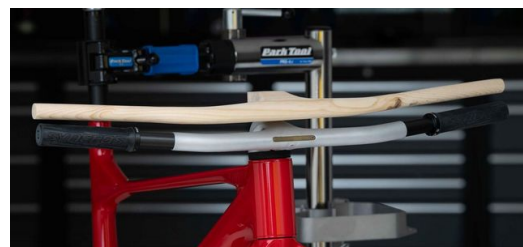
Un travail d'homme des cavernes : c'est ainsi que Dangerholm a qualifié son modèle en bois par rapport au guidon réalisé par TRUMPF.