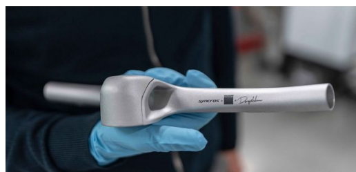
Un projet commun : Syncros, le fabricant de composants de Scott, le tueur de vélos extrêmes Dangerholm et l'entreprise de haute technologie TRUMPF fabriquent un guidon pour le vélo du futur.