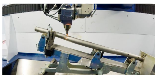
Avec l'installation laser 3D TruLaser Cell 8030 de TRUMPF, il est possible de découper des contours précis qui ne peuvent pas être introduits avant le pliage, car ils se déformeraient.