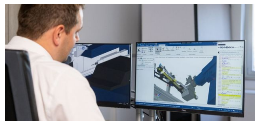
La chaîne de processus automatisée d'usinage de tubes et sa