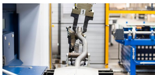
Les installations du réseau de machines sont commandées de manière automatisée par un système robotique qui transporte les pièces d'une étape d'usinage à la suivante.