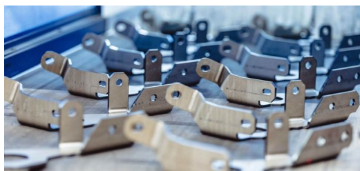
Dans son propre atelier de tôlerie, MERZ traite au quotidien entre 10 et 15 tonnes de tôle fine en trois-huit. Une variance élevée de pièces dans le