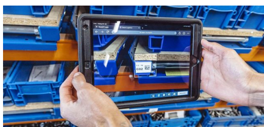
À chaque poste de travail, les employés enregistrent chaque étape de travail du début à la fin sur des tablettes dans une application. L'accès mobile à toutes les informations facilite le travail quotidien et apporte de la transparence dans les processus.