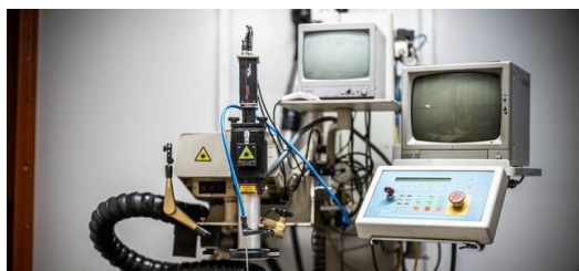
Ce qui convainc reste en service. Parallèlement, BBW investit régulièrement dans les dispositifs laser les plus récents du marché et élargit constamment son portefeuille.