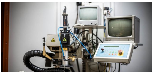
Ce qui convainc reste en service. Parallèlement, BBW investit régulièrement dans les dispositifs laser les plus récents du marché et élargit constamment son portefeuille.