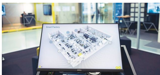
Les données machine, telles qu'elles sont collectées par TRUMPF dans son Usine du Futur, aident l'équipe de vision par ordinateur à entraîner l'IA.