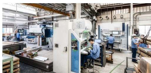
Différentes machines TRUMPF dans le hall de production de KANEYOSHI assurent une fabrication efficace.