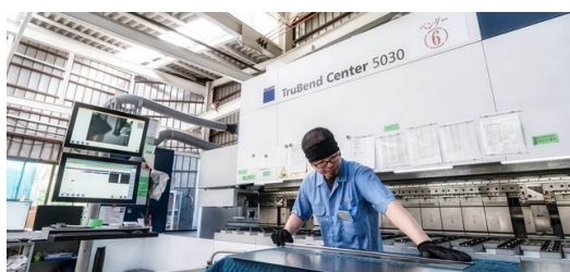
Un employé travaille sur la TruBend Center 5030 : voilà comment la chaise « Orisu » est produite.