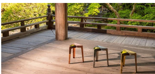
La chaise « Orisu » est très particulière : elle rend des technologies abstraites visibles à l'observateur.