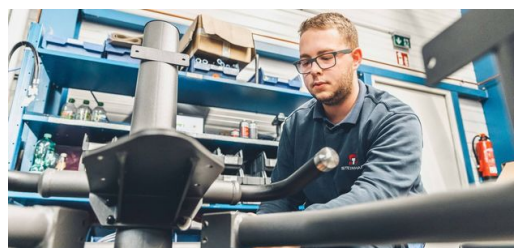
La tringlerie d'un appareil de fitness EGYM se compose principalement de tubes d'acier ovales. Après l'usinage avec une machine de découpe de tubes au laser TRUMPF, elle reçoit une finition élégante gris foncé via une application de poudre.