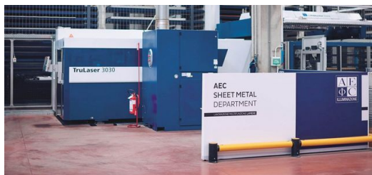
Avec l'acquisition de la machine de découpe laser 2D TruLaser 3030 fiber, AEC Illuminazione a posé la première pierre vers une étroite collaboration avec TRUMPF. La connexion au magasin automatisé a permis d'accélérer considérablement la production.

problème lors d'une étape de fabrication, le processus entier est rapidement perturbé. Au pire des cas, des palettes avec des pièces finies attendent dans les allées pour un traitement ultérieur. Afin d'éviter ce genre de situation, le flux d'informations doit être transparent et continu. C'est la raison pour laquelle Bianchi a déjà mis en réseau 85 % de toutes ses machines. Le système de contrôle de la production MES crée des plans de production et assure la fluidité de la production. Les constructeurs transmettent leurs plans CAO directement à la machine. Les données y sont lues puis les pièces sont fabriquées lorsqu'elles sont requises. De plus, le MES collecte les données de la machine et les indicateurs de performances pour la surveillance de la qualité, le taux d'utilisation machine ainsi que le statut de la production. « Grâce à cette mise en réseau complète, nous avons réussi à rendre notre production transparente. Cette planification de la production orientée vers les collaborateurs et la machine nous aide à augmenter les durées d'exécution et à améliorer durablement notre fiabilité de livraison », résume Bianchi.