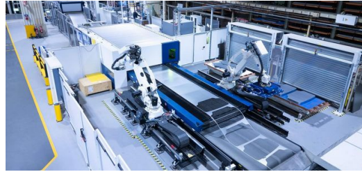
Vue d'ensemble de la TruLaser 8000 Coil Edition : sur cette image, on remarque à quel point les chutes de tôle sont moins nombreuses lorsque Fendt découpe à partir d'une bobine et non à partir de la feuille de tôle.