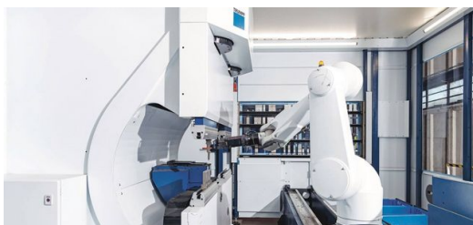
Cellule de pliage à grande vitesse innovante : le système compact de la TruBend Cell 7000 permet de plier de petites pièces de manière ultra-rapide