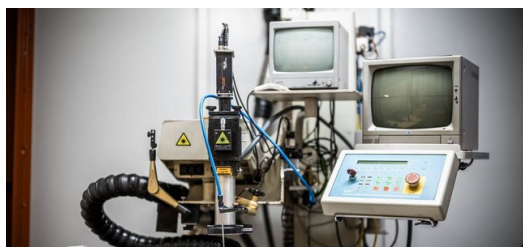
Ce qui convainc reste en service. Parallèlement, BBW investit régulièrement dans les dispositifs laser les plus récents du marché et élargit constamment son portefeuille.