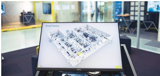
Les données machine, telles qu'elles sont collectées par TRUMPF dans son Usine du Futur, aident l'équipe de vision par ordinateur à entraîner l'IA.