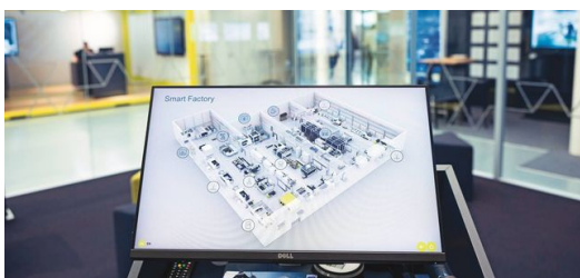
Les données machine, telles qu'elles sont collectées par TRUMPF dans son Usine du Futur, aident l'équipe de vision par ordinateur à entraîner l'IA.