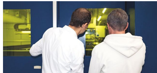
Des données, encore des données : plus il y a de petites caméras dans un TruLaser Center 7030, plus l'équipe de Korbinian Weiß reçoit de données. Les spécialistes de l'équipe les utilisent pour entraîner l'IA. Plus il y a de données, meilleurs sont les résultats.