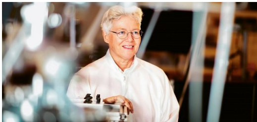
Prof. Anne L'Huillier a auparavant ouvert la porte pour la physique d'impulsions laser en attosecondes. Avec sa recherche, elle s'attaque aujourd'hui aux électrons.

L'Huillier : Il est difficile de donner une vision bien définie. C'est justement la recherche de base.