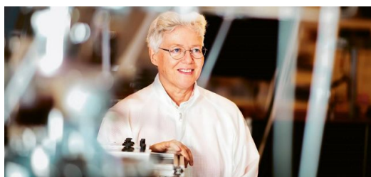
Prof. Anne L'Huillier a auparavant ouvert la porte pour la physique d'impulsions laser en attosecondes. Avec sa recherche, elle s'attaque aujourd'hui aux électrons.

L'Huillier : Il est difficile de donner une vision bien définie. C'est justement la recherche de base.