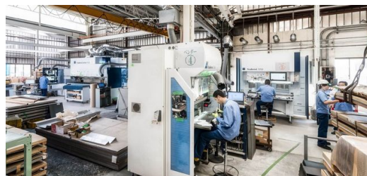
Différentes machines TRUMPF dans le hall de production de KANEYOSHI assurent une fabrication efficace.