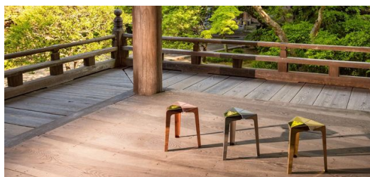
La chaise « Orisu » est très particulière : elle rend des technologies abstraites visibles à l'observateur.