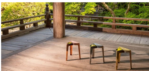
La chaise « Orisu » est très particulière : elle rend des technologies abstraites visibles à l'observateur.