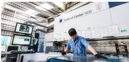
Un employé travaille sur la TruBend Center 5030 : voilà comment la chaise « Orisu » est produite.