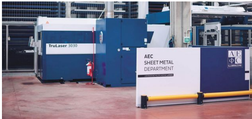
Avec l'acquisition de la machine de découpe laser 2D TruLaser 3030 fiber, AEC Illuminazione a posé la première pierre vers une étroite collaboration avec TRUMPF. La connexion au magasin automatisé a permis d'accélérer considérablement la production.

problème lors d'une étape de fabrication, le processus entier est rapidement perturbé. Au pire des cas, des palettes avec des pièces finies attendent dans les allées pour un traitement ultérieur. Afin d'éviter ce genre de situation, le flux d'informations doit être transparent et continu. C'est la raison pour laquelle Bianchi a déjà mis en réseau 85 % de toutes ses machines. Le système de contrôle de la production MES crée des plans de production et assure la fluidité de la production. Les constructeurs transmettent leurs plans CAO directement à la machine. Les données y sont lues puis les pièces sont fabriquées lorsqu'elles sont requises. De plus, le MES collecte les données de la machine et les indicateurs de performances pour la surveillance de la qualité, le taux d'utilisation machine ainsi que le statut de la production. « Grâce à cette mise en réseau complète, nous avons réussi à rendre notre production transparente. Cette planification de la production orientée vers les collaborateurs et la machine nous aide à augmenter les durées d'exécution et à améliorer durablement notre fiabilité de livraison », résume Bianchi.