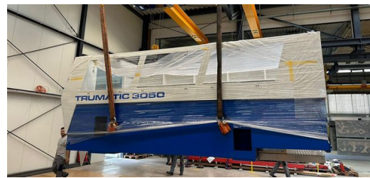
Carga pesada: la barra de siete toneladas al llegar a la nave de montaje de la empresa Matussek Metalltechnik.