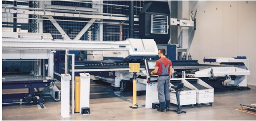
Soldadura, punzonado, plegado: las máquinas TRUMPF garantizan la máxima calidad de las piezas, productividad y flexibilidad en Elpro.