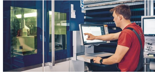
Socio codiciado: el nombre Elpro Križnič es sinónimo de soluciones completas de alta calidad, tanto en el mecanizado de chapa como en la industria energética.