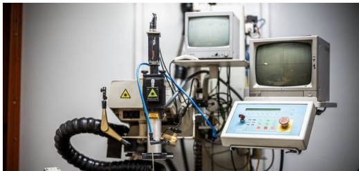
Lo que conviene, se mantiene en uso. Al mismo tiempo, BBW invierte regularmente en los sistemas láser más nuevos del mercado y amplía su gama de forma continua.