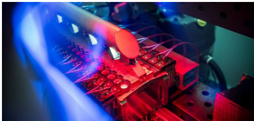
La fabricación de módulos de baterías tiene tanto éxito en BBW que ya han tenido que ampliar el espacio dos veces en poco tiempo.

Como nadie puede desarrollarlo todo solo, BBW participa en proyectos de investigación internacionales. Para el proyecto de investigación LaserComposite, financiado por el Programa Central de Innovación para las PYME, utilizaron un láser verde y otro infrarrojo y trabajaron en la soldadura de juntas mixtas de aluminio y cobre. Resultado: su proceso de unión evita en gran medida que los metales se mezclen en el cordón para formar fases intermetálicas indeseables, es decir, aleaciones. Por otra parte, en su propio proyecto de desarrollo Weldshape, abordaron la soldadura de grietas calientes en la aleación de aluminio AW-6060, que es muy susceptible de sufrirlas. El medio para conseguir un fin: un proceso con moldeo por rayo dinámico en un sistema láser de construcción propia con un láser monomodo de 16 kilovatios y un escáner de alto rendimiento.