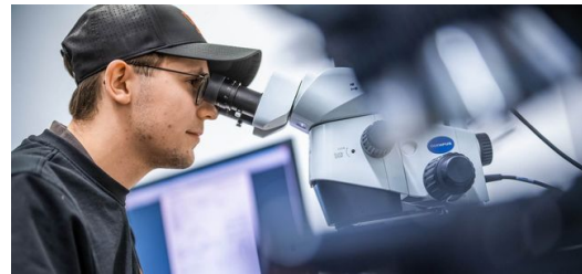
Mejorando e investigando sin descanso: esto hace felices a los clientes y fue premiado en 2023 con el Bayerns Best 50 Award.