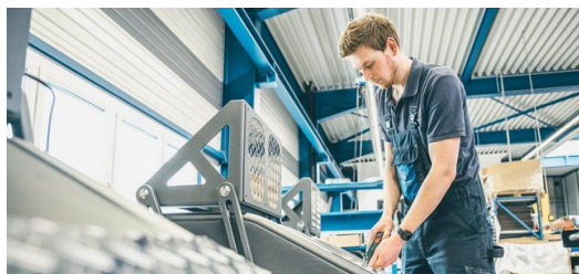
La TruMatic 7000 corta y da forma a las chapas estriadas de aluminio para las máquinas EGYM sin arañazos y con la mejor calidad.