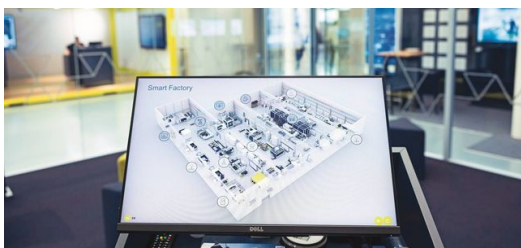
Los datos de las máquinas que TRUMPF recoge en su Smart Factory ayudan al equipo de Computer Vision a entrenar la IA.

En este modelo de negocio, el buque insignia completamente automatizado de la empresa de alta tecnología se encuentra en la nave del cliente y produce allí las piezas necesarias, pero un equipo de TRUMPF en Neukirch, en Sajonia, se encarga del control en tres turnos, también por la noche. Las cámaras permiten al equipo observar el interior de la máquina y obtener datos de forma ininterrumpida. Si se atasca una chapa, las cámaras graban un clip de vídeo desde unos segundos antes hasta unos segundos después. Esto, a su vez, permite entrenar la IA para evitar esos errores en el futuro. Una utilización más eficiente de las máquinas, tiempos de funcionamiento más largos, mayores cantidades de piezas, ahorro de material, predicciones de mantenimiento, sistemas de asistencia... Las posibles aplicaciones de la IA son diversas y son solo el comienzo. «Ahora mismo están pasando muchas cosas en el campo de Visión», afirma Korbinian Weiß, y espera con impaciencia el año 2024. Por ejemplo, las cámaras inteligentes, en las que incluso se utiliza IA, pronto serán importantes en las máquinas de TRUMPF.