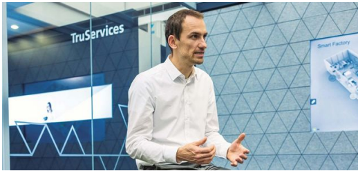
Explicar la IA: el experto de Computer Vision de TRUMPF está encantado de explicar cómo la IA ayuda con el corte de chapas.