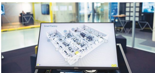
Los datos de las máquinas que TRUMPF recoge en su Smart Factory ayudan al equipo de Computer Vision a entrenar la IA.

En este modelo de negocio, el buque insignia completamente automatizado de la empresa de alta tecnología se encuentra en la nave del cliente y produce allí las piezas necesarias, pero un equipo de TRUMPF en Neukirch, en Sajonia, se encarga del control en tres turnos, también por la noche. Las cámaras permiten al equipo observar el interior de la máquina y obtener datos de forma ininterrumpida. Si se atasca una chapa, las cámaras graban un clip de vídeo desde unos segundos antes hasta unos segundos después. Esto, a su vez, permite entrenar la IA para evitar esos errores en el futuro. Una utilización más eficiente de las máquinas, tiempos de funcionamiento más largos, mayores cantidades de piezas, ahorro de material, predicciones de mantenimiento, sistemas de asistencia... Las posibles aplicaciones de la IA son diversas y son solo el comienzo. «Ahora mismo están pasando muchas cosas en el campo de Visión», afirma Korbinian Weiß, y espera con impaciencia el año 2024. Por ejemplo, las cámaras inteligentes, en las que incluso se utiliza IA, pronto serán importantes en las máquinas de TRUMPF.