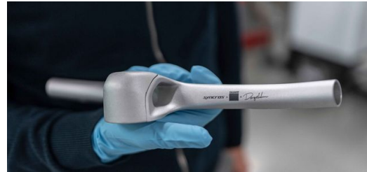
Proyecto común: Syncros, la herrería para componentes de Scott, Dangerholm, el tuneador de bicis para ciclismo extremo y la empresa de alta tecnología TRUMPF construyen un manillar para la bicicleta del futuro.