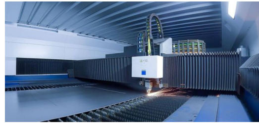
El cabezal láser se desliza sobre la aparentemente interminable banda de chapa y corta los contornos de las partes exteriores de la superficie exterior de los tractores Fendt.