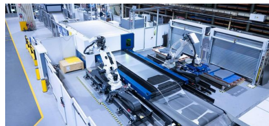
Una vista completa de la TruLaser 8000 Coil Edition: esta imagen muestra cuánto menos desperdicio de chapa queda cuando Fendt corta a partir del rollo en lugar de la plancha de chapa.