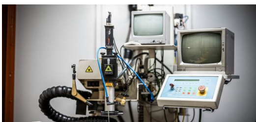
Lo que conviene, se mantiene en uso. Al mismo tiempo, BBW invierte regularmente en los sistemas láser más nuevos del mercado y amplía su gama de forma continua.