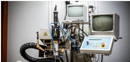
Lo que convence, se mantiene en uso. Al mismo tiempo, BBW invierte regularmente en los sistemas láser más nuevos del mercado y amplía su gama de forma continua.