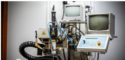
<p>Lo que convence, se mantiene en uso. Al mismo tiempo, BBW invierte regularmente en los sistemas láser más nuevos del mercado y amplía su gama de forma continua.</p>