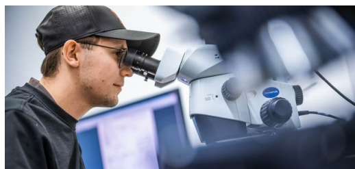
Mejorando e investigando sin descanso: esto hace felices a los clientes y fue premiado en 2023 con el Bayerns Best 50 Award.