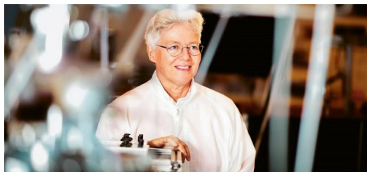
La catedrática Anne L'Huillier abrió en su día la puerta a la física de los pulsos láser de attosegundos. Con sus investigaciones, ahora estrecha el cerco sobre los electrones.

L'Huillier: Es difícil ofrecer una visión bien definida. Se trata de investigación básica.