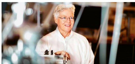
La catedrática Anne L'Huillier abrió en su día la puerta a la física de los pulsos láser de attosegundos. Con sus investigaciones, ahora estrecha el cerco sobre los electrones.

L'Huillier: Es difícil ofrecer una visión bien definida. Se trata de investigación básica.